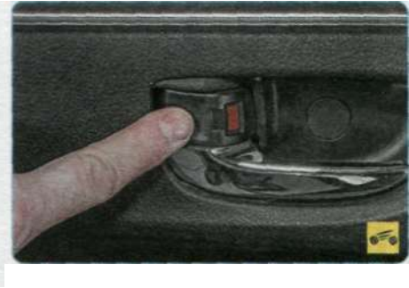
...или повернув назад до щелчка клавишу блокировки. При этом станет видна красная метка на клавише.