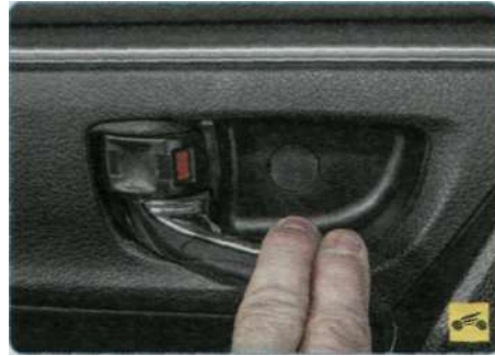
...или внутреннюю ручку.