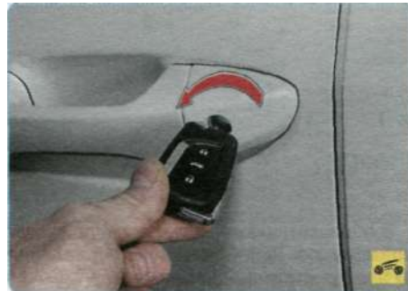
Передние двери можно заблокировать снаружи ключом...

Нажатие (поворот) клавиши блокировки на двери водителя приводит к блокировке (разблокировке) всех дверей.