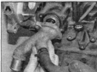
3.9b ...и отверните болты крепления корпуса термостата.