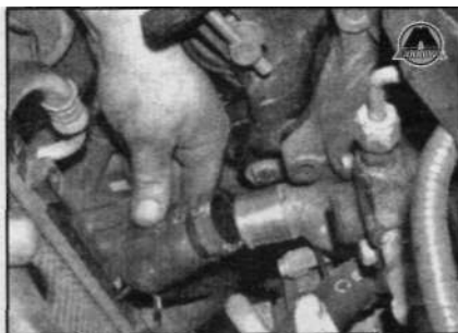
3.9a Отсоедините шланги...